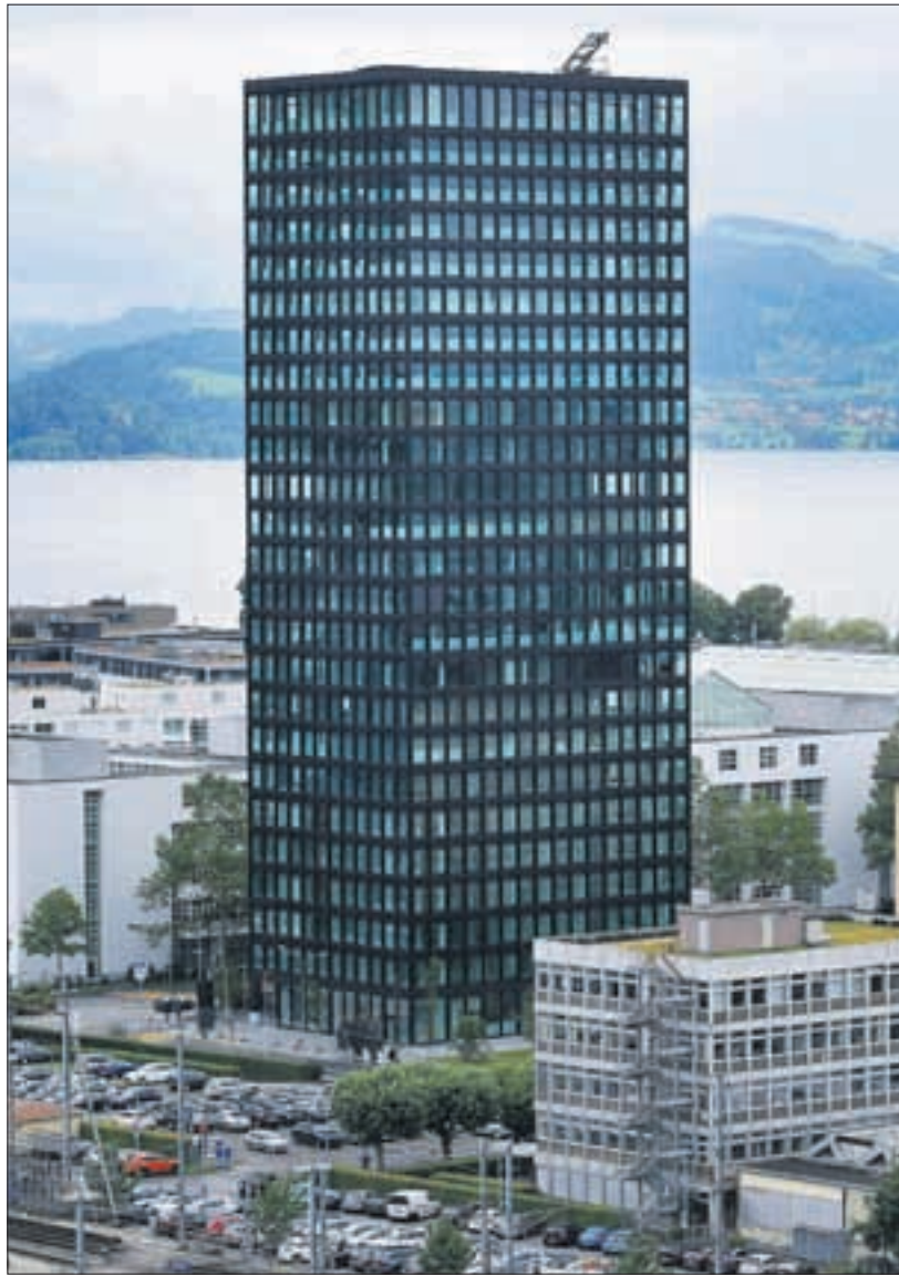
Der Park-Tower in Zug, mit 81 Metern das grösste Hochhaus im Kanton.

Für ihn als leidenschaftlichen Velofahrer sei es zudem ein Vorteil, dass der Zugerberg so nahe und ideal gelegen sei, und mit seiner Frau sei er bereits in der Stadt flanieren gegangen. «Zug gefällt uns sehr», freut sich der Bundes-