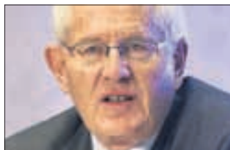
«Zug ist ein schönes Städtchen.»