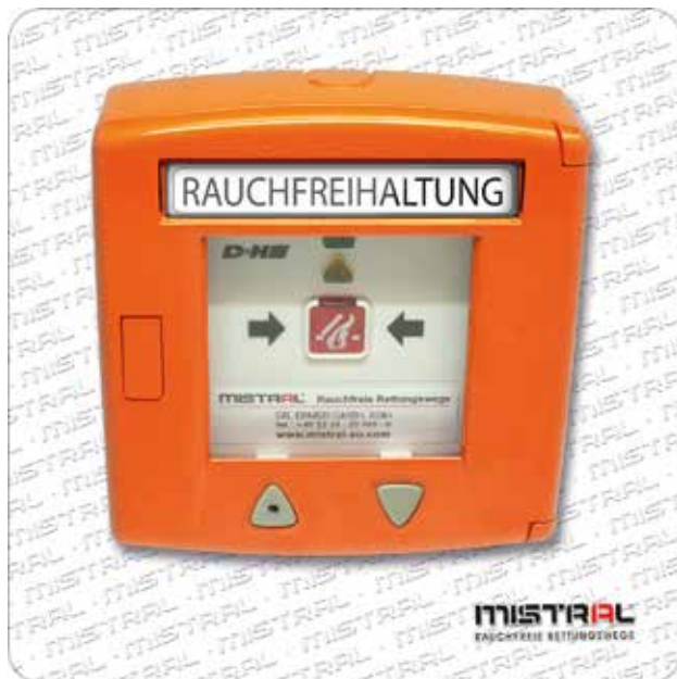
RDA-Bedienstelle RT 45-LT