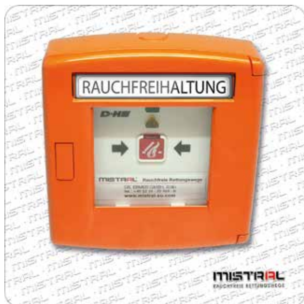
RDA-Bedienstelle RT 45